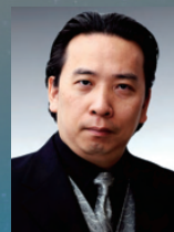
バリトン 甲斐栄次郎